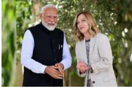
पीएम मोदी और मेलोनी की मुलाकात इटली के अपुलिया में हुई।

ये पहली बार नहीं कि जब पीएम मोदी और मेलोनी गर्मजोशी से मिले हो। आपको जार्जिया मेलोनी की ली गई 6 महीने पुरानी सेल्फी याद होगी। जिसके कैप्शन ने इंटरनेट सनसनी मचा दी थी। मेलोनी ने इसके कैप्शन में लिखा था गुड फ्रेंड्स एट कॉप 2024, है शार्ट ग मेलोडी। यानी मेलोनी और मोदी। दोस्ती के इस पैगाम पर पीएम मोदी का जवाब आया और लिखा कि दोस्तों से मिलना हमेशा अच्छा