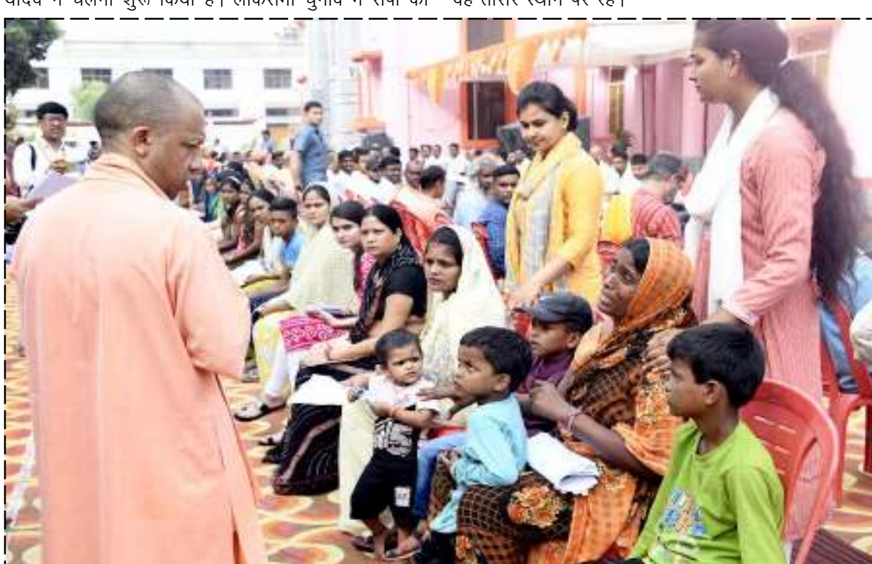
मुख्यमंत्री योगी आदित्यनाथ श्री गोरक्षनाथ मन्दिर परिसर, गोरखपुर में लोगों की समस्याओं को सुनते हुए।