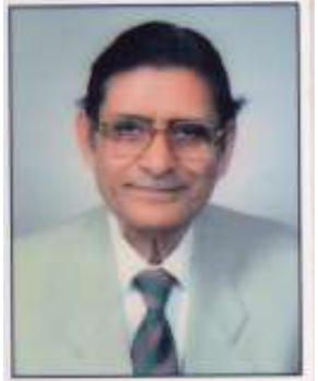
प्रयागराज के सुविख्यात